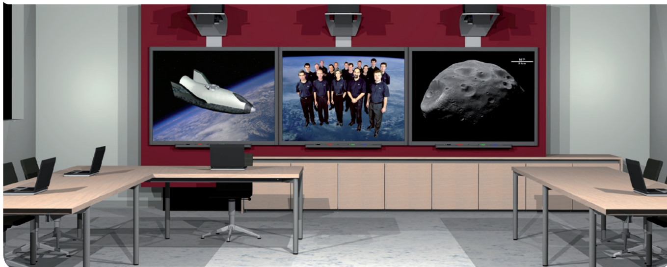
Am Sitz von Vanerum in Bochum nutzen 12 Mitarbeiter heute die Vorteile des Dokumenten-Management-Systems von Canon.