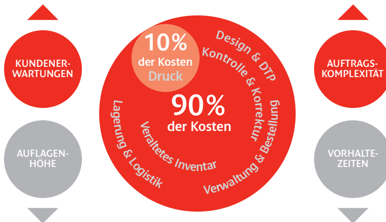
Die tatsächlichen Kosten eines Drucks

Unsere Lösungen für den Produktionsworkflow tragen dazu bei, Qualität und Umfang Ihres Serviceangebots zu verbessern. Jede Lösung kann auf Ihre besonderen Anforderungen hin maßgeschneidert werden und ist so konzipiert, dass sie mit Ihrem Geschäft wächst. Das Ergebnis: Sie sind der Konkurrenz den entscheidenden Schritt voraus – den, der zum Kunden führt.